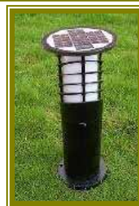
Cf. Fiche technique spécifique